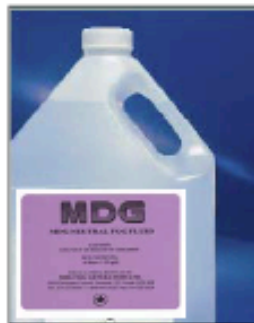
MDGLow Fog Fluid