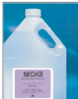
MDG Neutral Fluid