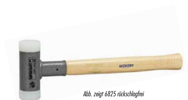
Abb. zeigt 6825 rückschlagfrei